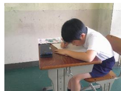
つくえと顔が近い