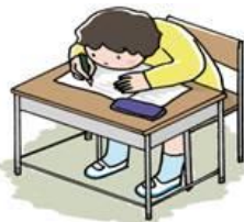
つくえと顔が近い